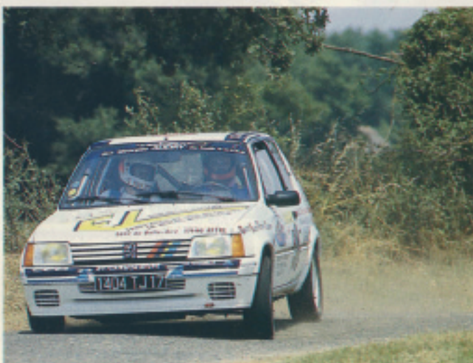
Alain Magné, après une belle bagarre face à Méchain.